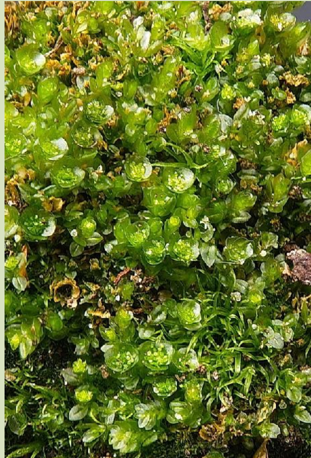
Viertandsmos Tetraphis pellucida