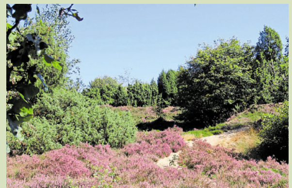
Mantingerzand met heide en jeneverbessen.

contacten met hen en bezoeken elkaars terreinen. Op deze dag werden we ontvangen door hun voorzitter