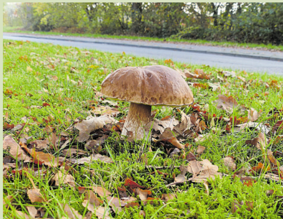
Eekhoornjesbrood, middenberm Zuidwoldigerweg