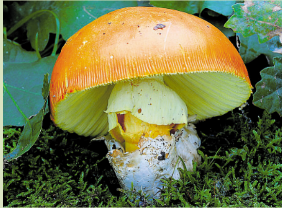
Keizeramaniet, zeer smakelijk.

Agrippina was de vierde vrouw van Ceasar Claudius. Zijn eerste drie huwelijken waren een ramp. Hij had één vrouw laten executeren. Agrippina haalde Claudius over haar zoon Nero te adopteren als zijn biologische zoon en troonopvolger. Toen wilde ze haar man kwijt ten behoeve van haar zoon. Ze maakte zijn favoriete maaltijd van keizeramanieten en boleten. Claudius was gewend eerst iemand anders te laten proeven van een maaltijd, bang als hij