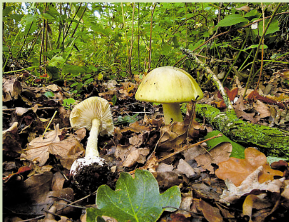
Groene knolamaniet is dodelijk.

Nu is het gewoon paddenstoelen uit het bos te halen. Er is zelfs nog een redelijk eetbare amaniet, de parelamaniet, althans als je die op een speciale manier kookt. Begin er maar niet aan. Oesterzwammen, champignons en shi-takes van de supermarkt zijn beter.