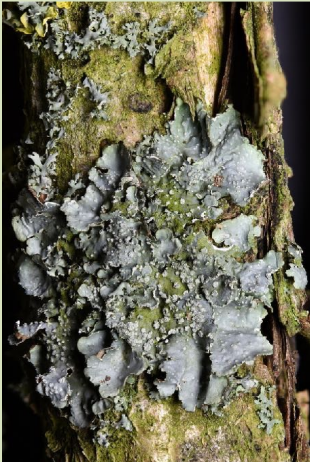
Gestippeld schildmos Punctella subrudecta