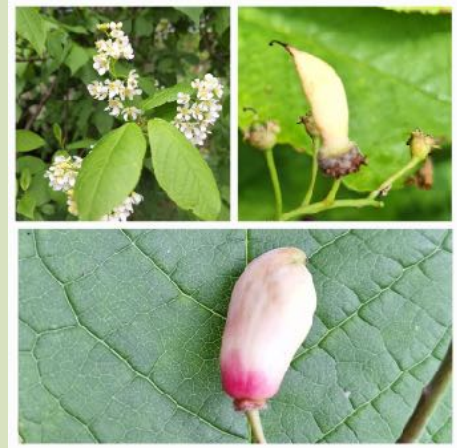
Prunus met vogelkersheksenbezem