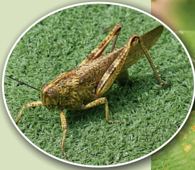
Trekspinkhaan in Kroatië.