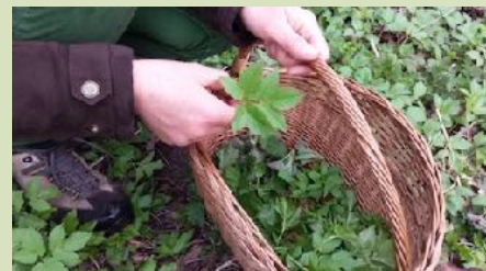
Zevenblad plukken

Kosten: € 10,- voor leden IVN-KNNV en € 15,- voor niet-leden (contant/pin). Alleen theorieavond kost € 2,50 voor leden en € 5,- voor niet-leden.