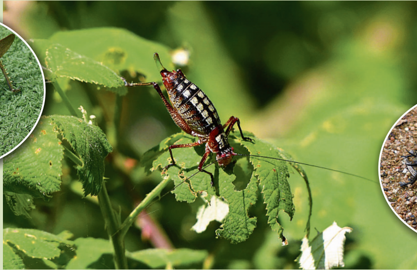
Krekel op Rhodos.